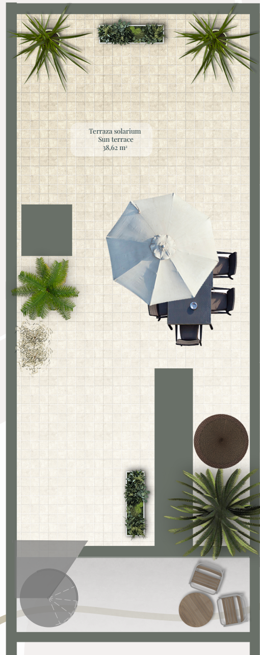
PLANTA CUBIERTA Rooftop