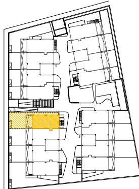
PLANTA BAJA. E 1:1500